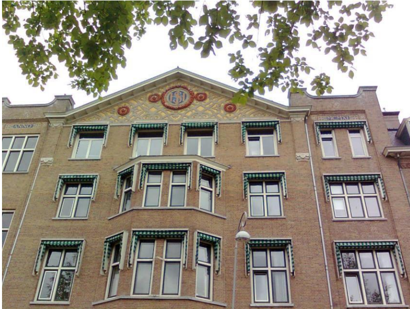
Het Patershuis van het St.-Ignatiuscollege te Amsterdam.

In mijn omvangrijk Ig-Essay heb ik minder dan anderen de medeleerlingen maar eerder de geweldig imponerende leraren beschreven die mijn leergierigheid opgewekt hebben.